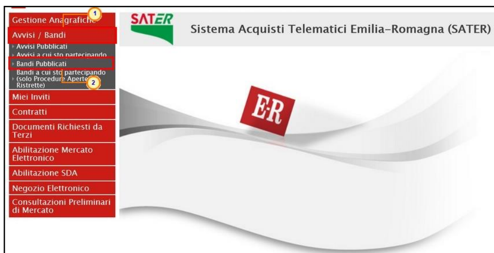
Figura 1: Bandi Pubblicati

ATTENZIONE: l'esempio che segue mostra l'esempio di una richiesta di accesso agli atti relativo ad un bando di una procedura di gara; le medesime indicazioni sono valide anche nel caso dell'invito e dell'avviso di una procedura di gara negoziata.