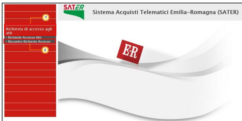
Figura 10: Richiesta di accesso agli atti – Riscontro Richieste Accesso

ATTENZIONE: la visualizzazione di eventuali riscontri è consentita a tutti gli utenti indicati tra i riferimenti nelle rispettive procedure di gara.