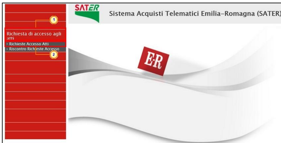
Figura 1: Richiesta di accesso agli atti – Riscontro Richieste Accesso

Nella parte alta della schermata che verrà visualizzata, è presente innanzitutto un'area di filtro che consente all'utente di effettuare ricerche, in base ad uno o più criteri ( es. Registro di Sistema, Partita Iva, Fornitore e Codice Fiscale ), tra le richieste nella tabella sottostante (se presenti).