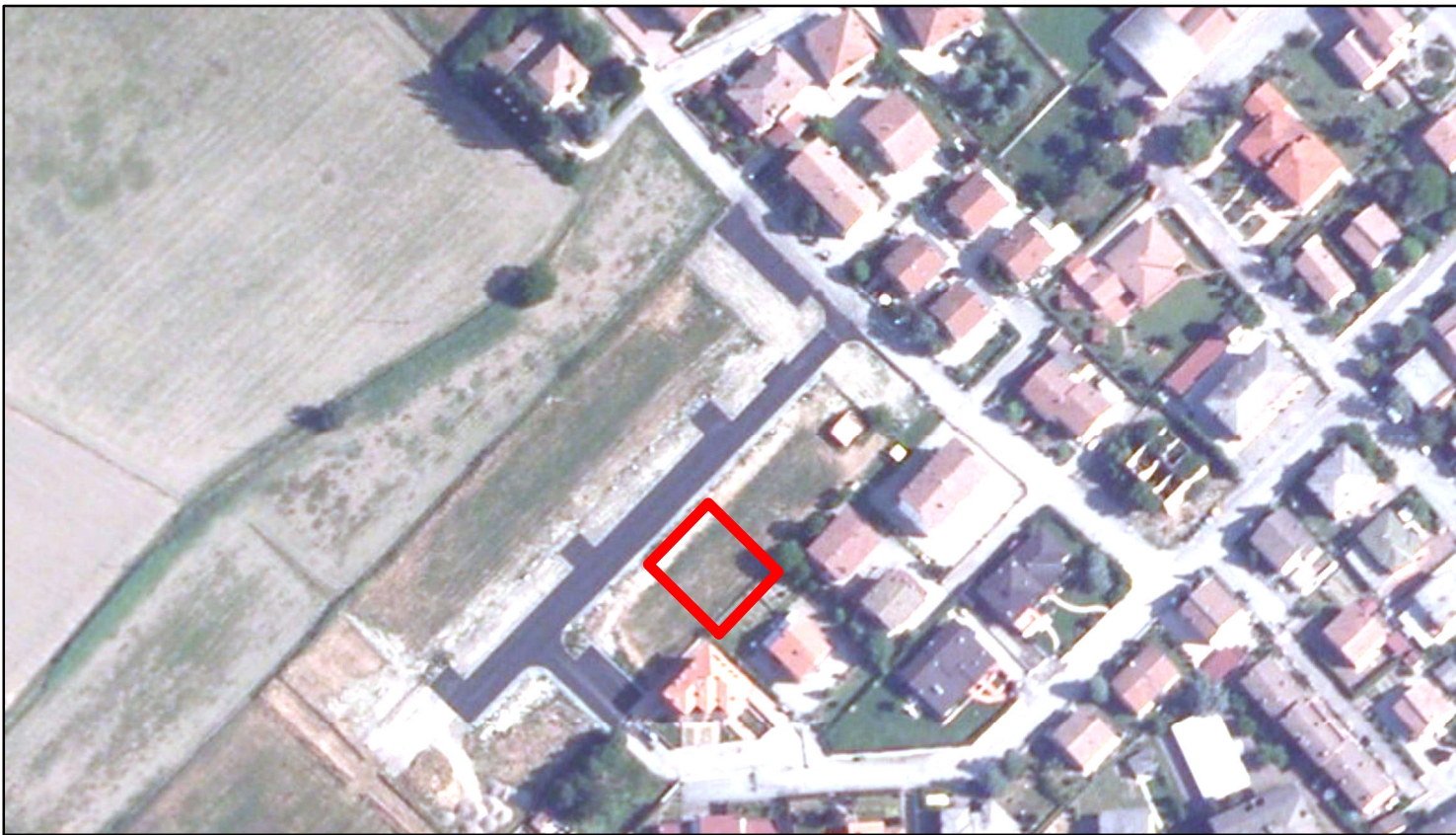
estratto ortofoto 0 25 50 100 150 200 Meters