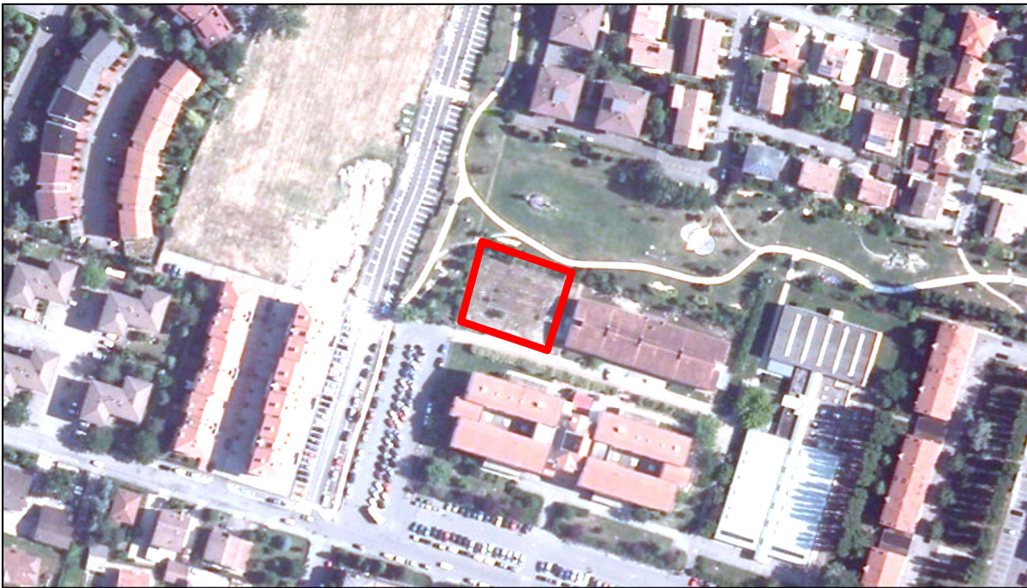
estratto ortofoto 0 25 50 100 150 200 Meters