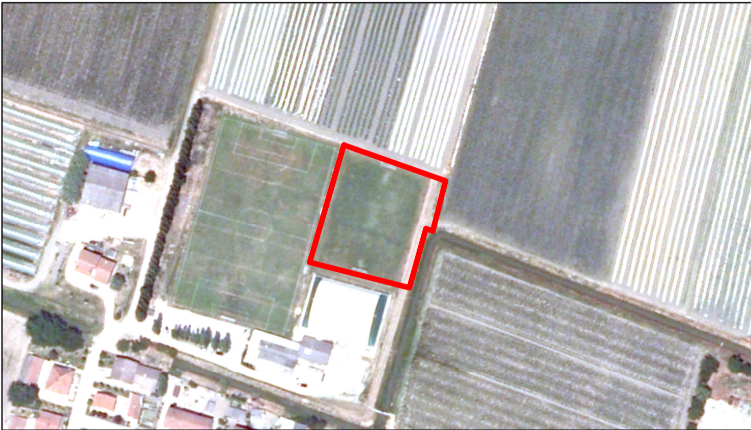
estratto ortofoto - Agea 2011 sc. 1:2000