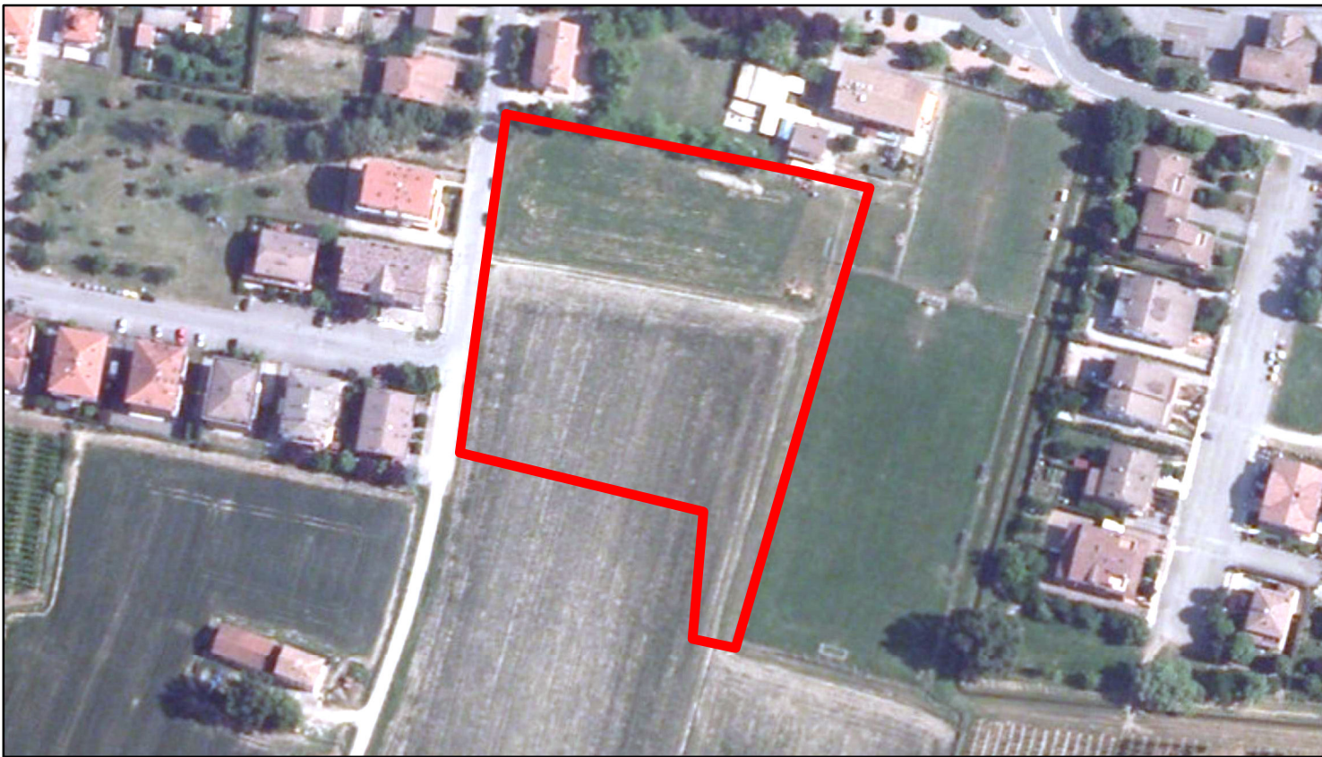
estratto ortofoto - Agea 2011 sc. 1:2000