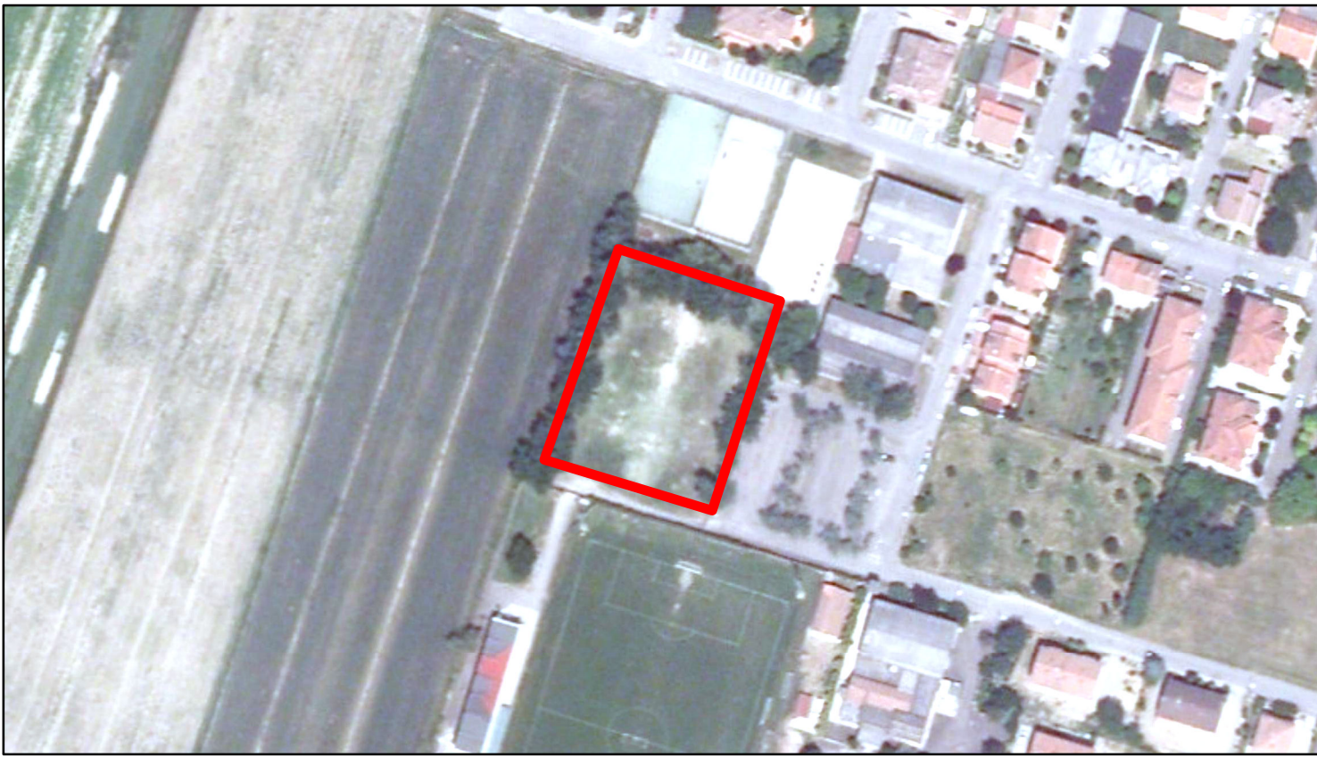
estratto ortofoto - Agea 2011 sc. 1:2000