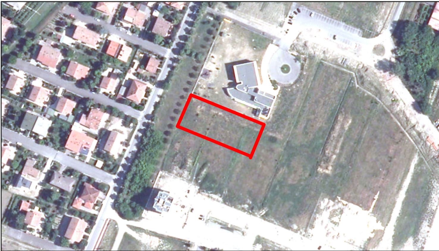
estratto ortofoto - Agea 2011 sc. 1:2000