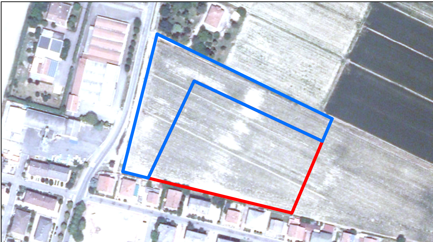
estratto ortofoto - Agea 2011 sc. 1:2500