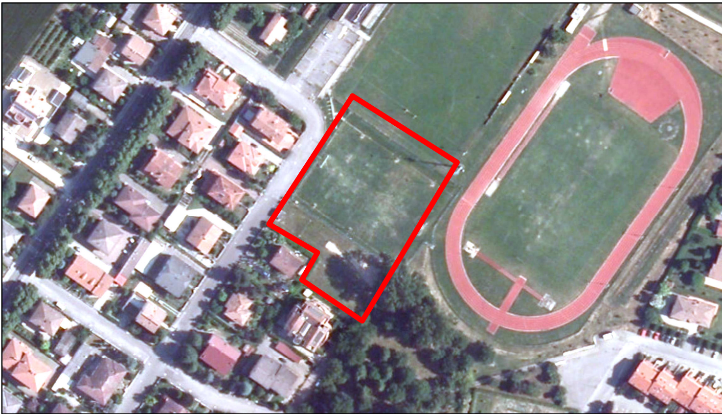
estratto ortofoto - Agea 2011 sc. 1:2000