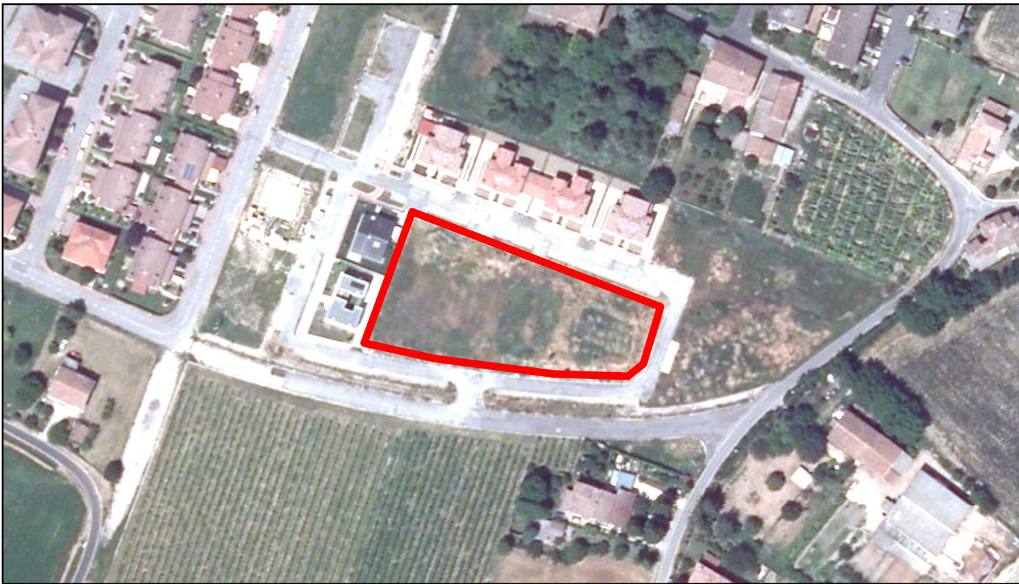
estratto ortofoto - Agea 2011 sc. 1:2000