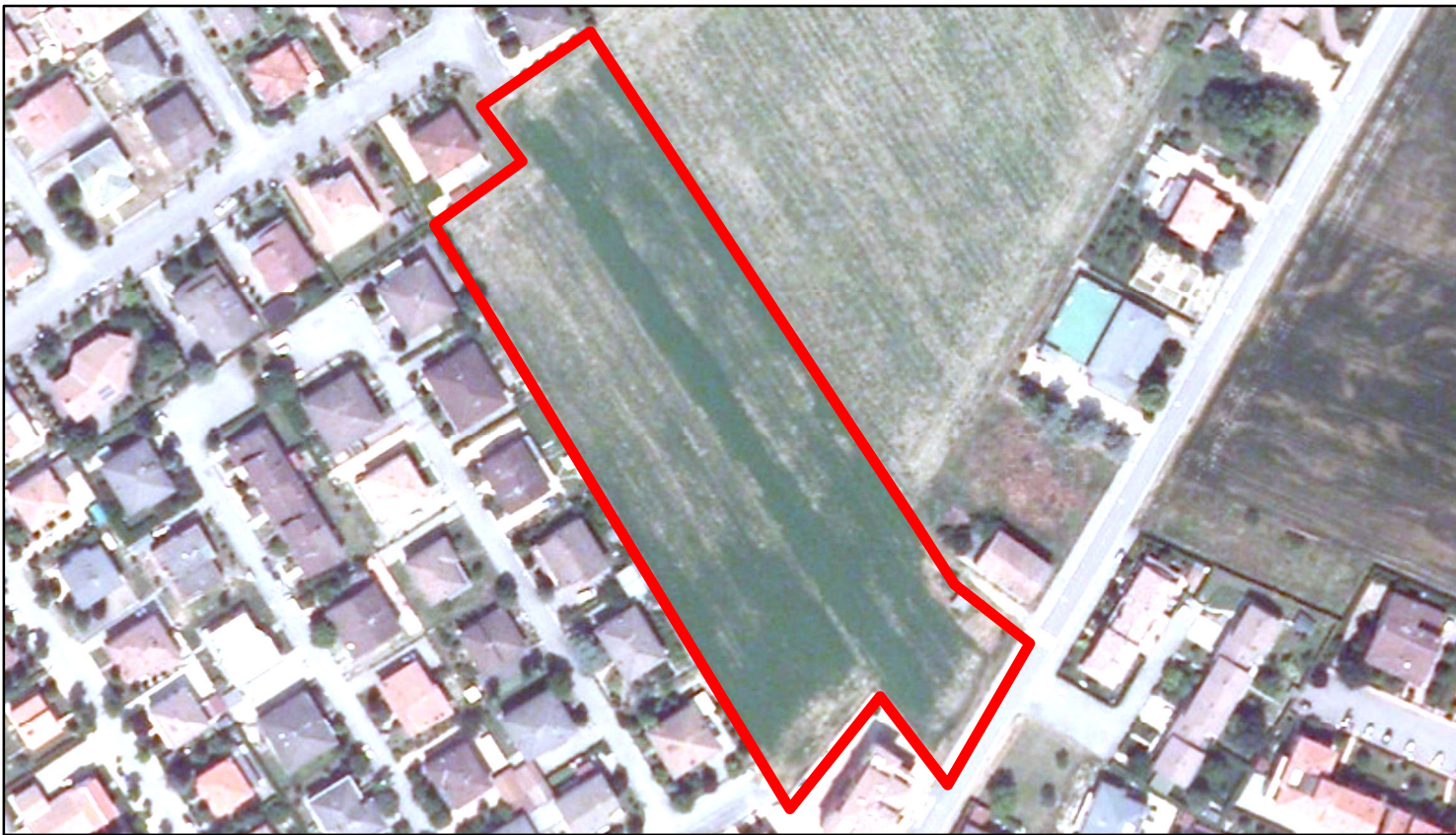
estratto ortofoto - Agea 2011 sc. 1:2000