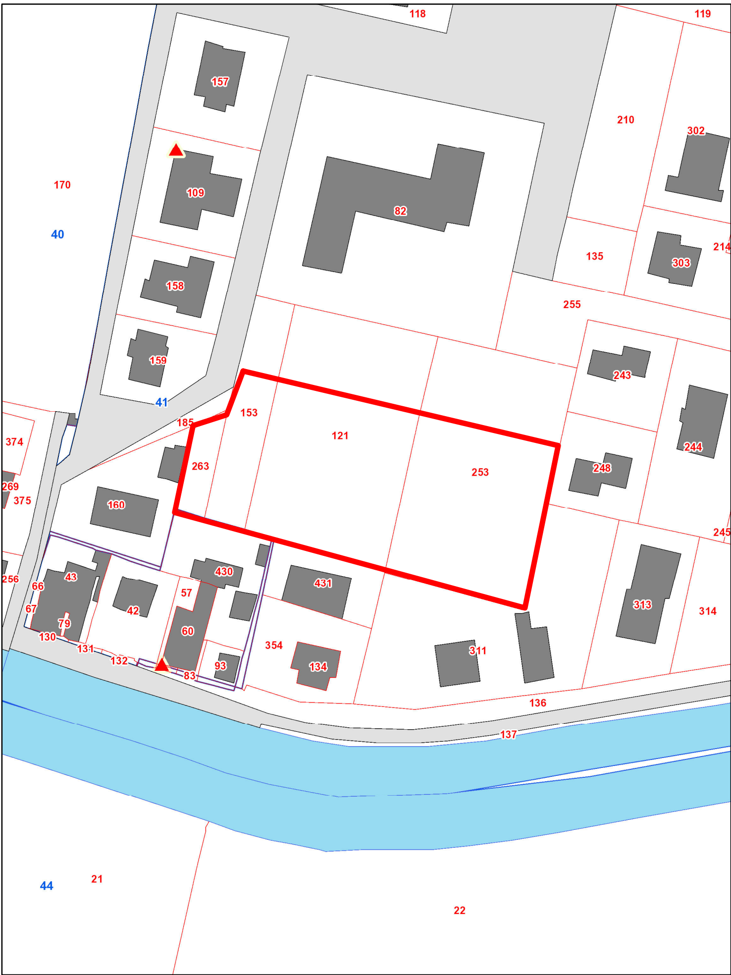
estratto catastale Fg 41 map.le 263, 153 parte, 121 parte, 253 parte sc. 1:1000