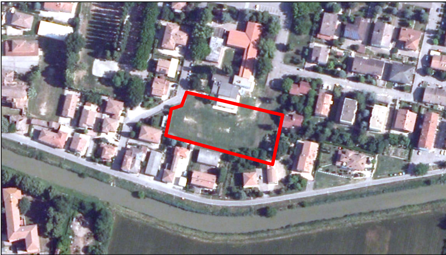
estratto ortofoto - Agea 2011 sc. 1:2000