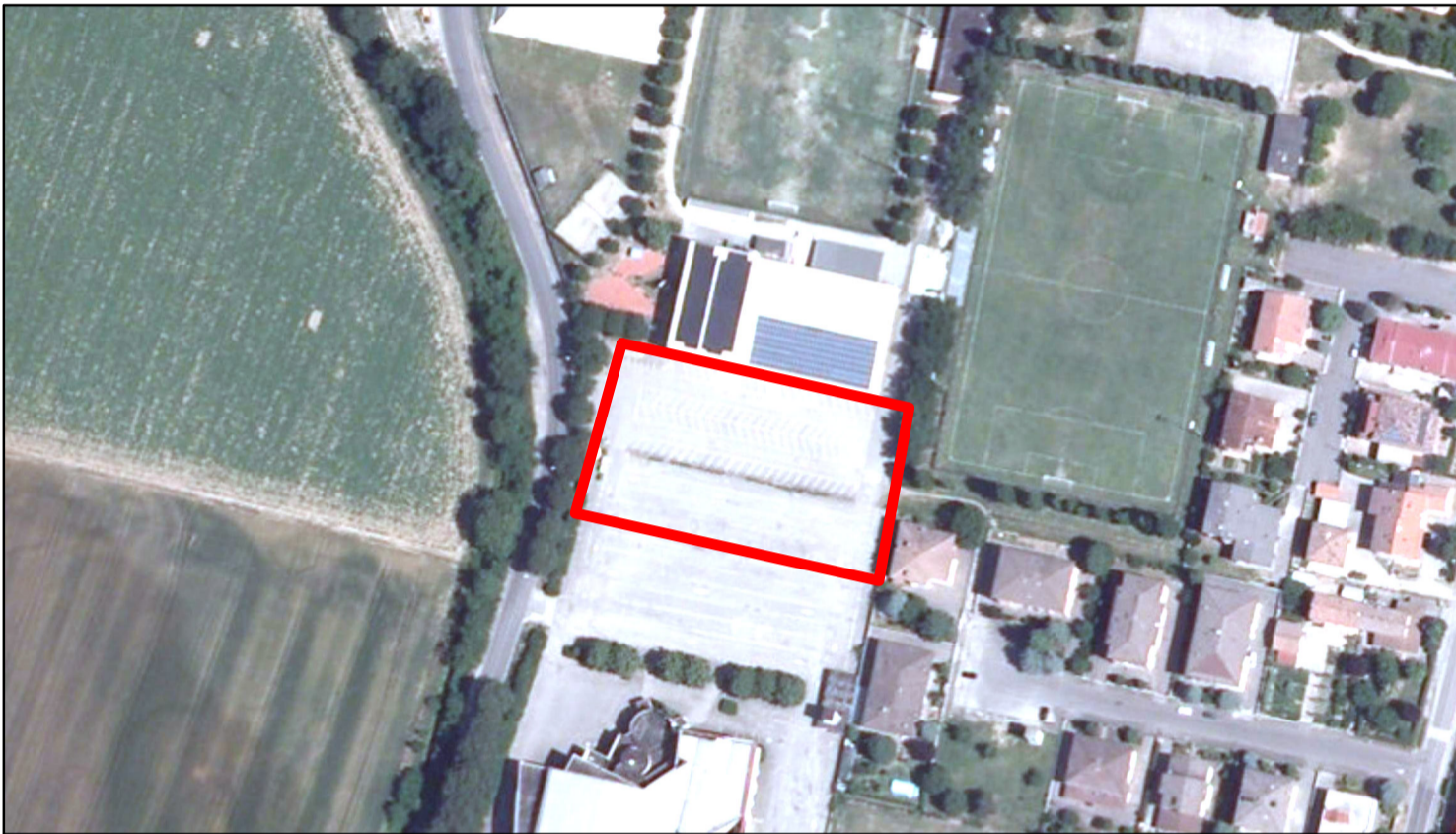
estratto ortofoto - Agea 2011 sc. 1:2000