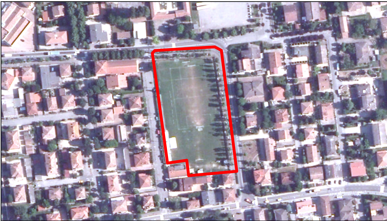
estratto ortofoto - Agea 2011 sc. 1:2000