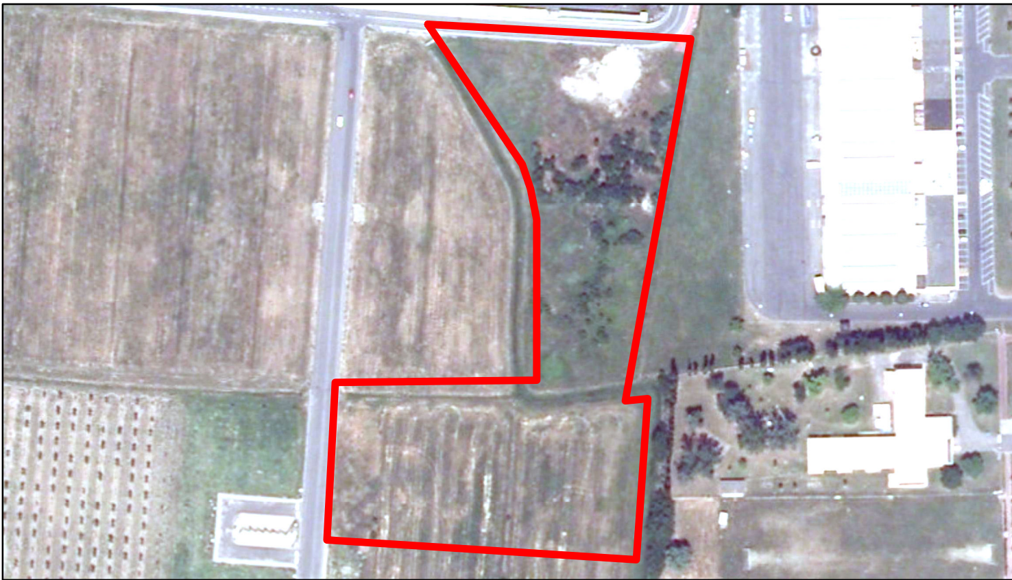
estratto ortofoto - Agea 2011 sc. 1:2500