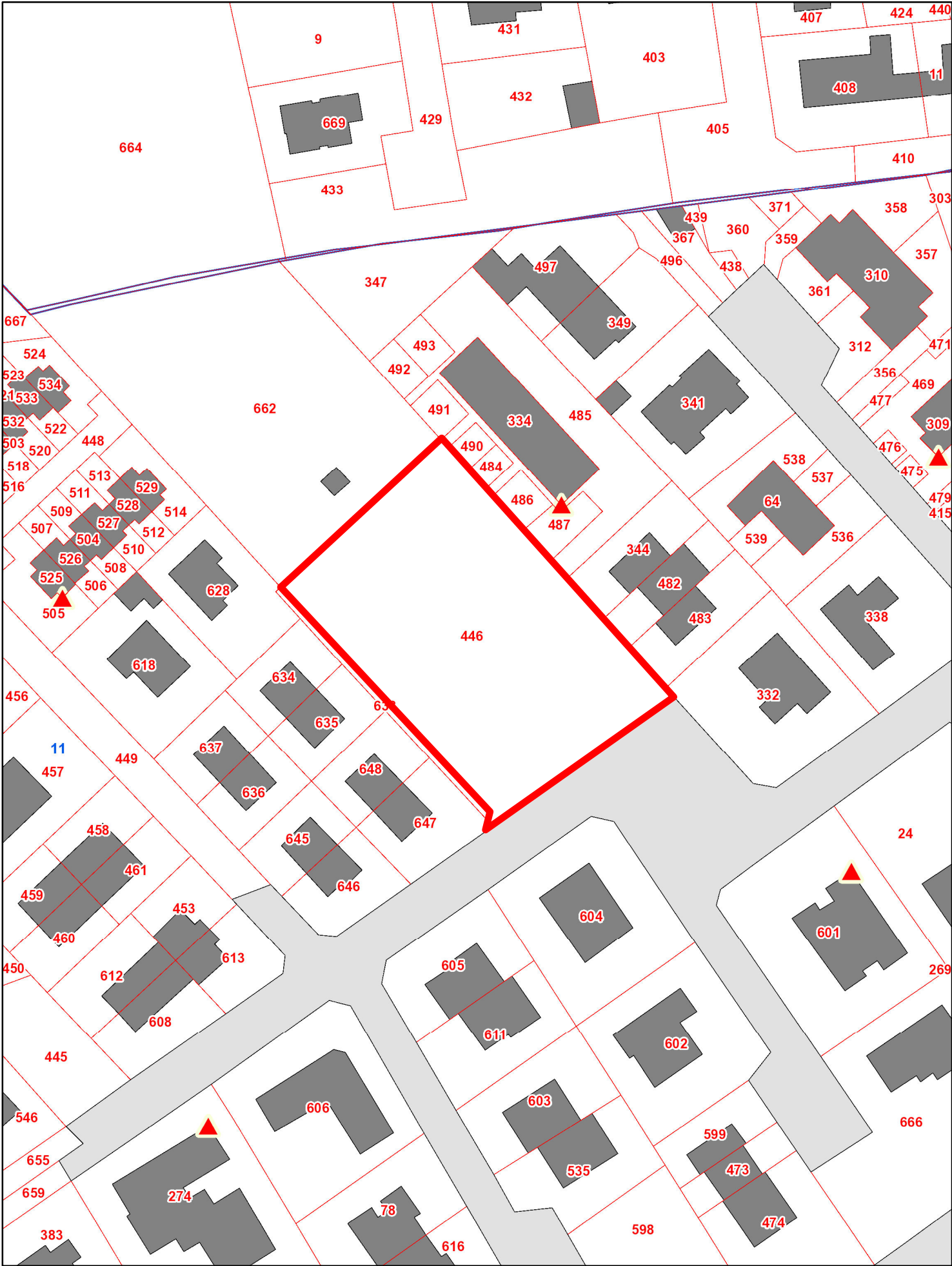
estratto catastale Fg 11 map.le 446 sc. 1:1000