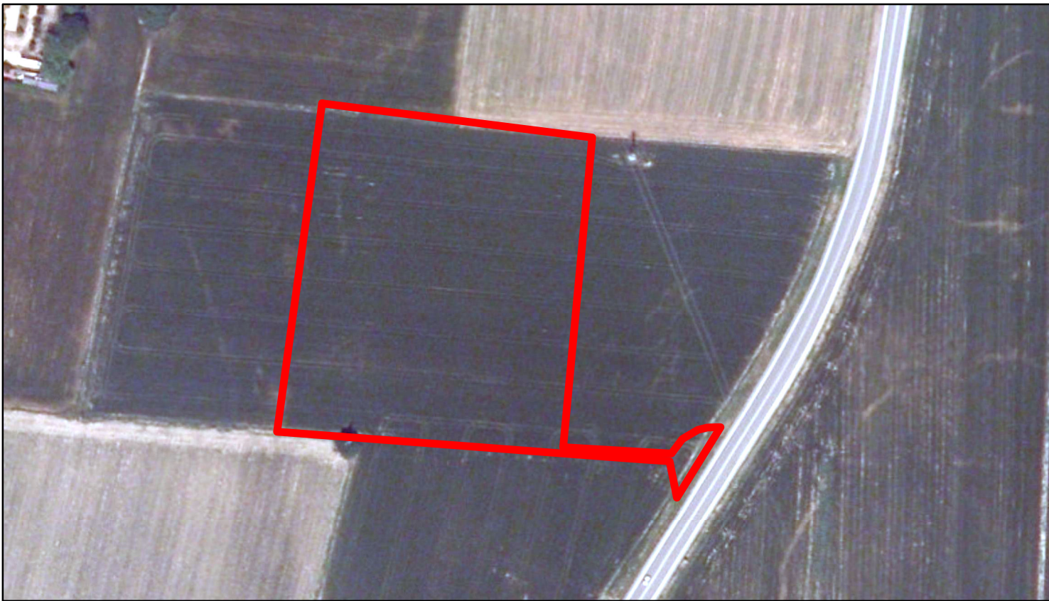
estratto ortofoto - Agea 2011 sc. 1:2000