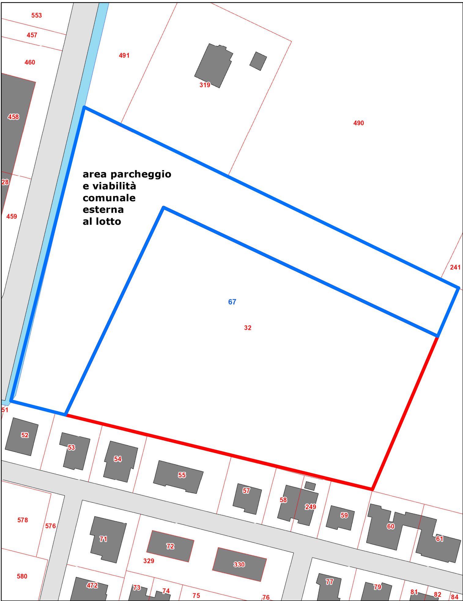
estratto catastale Fg 67 map.le 32 parte sc. 1:1000