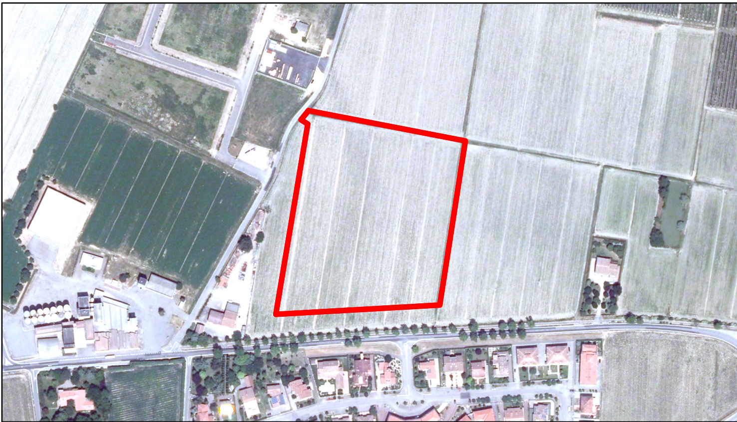
estratto ortofoto - Agea 2011 sc. 1:4000