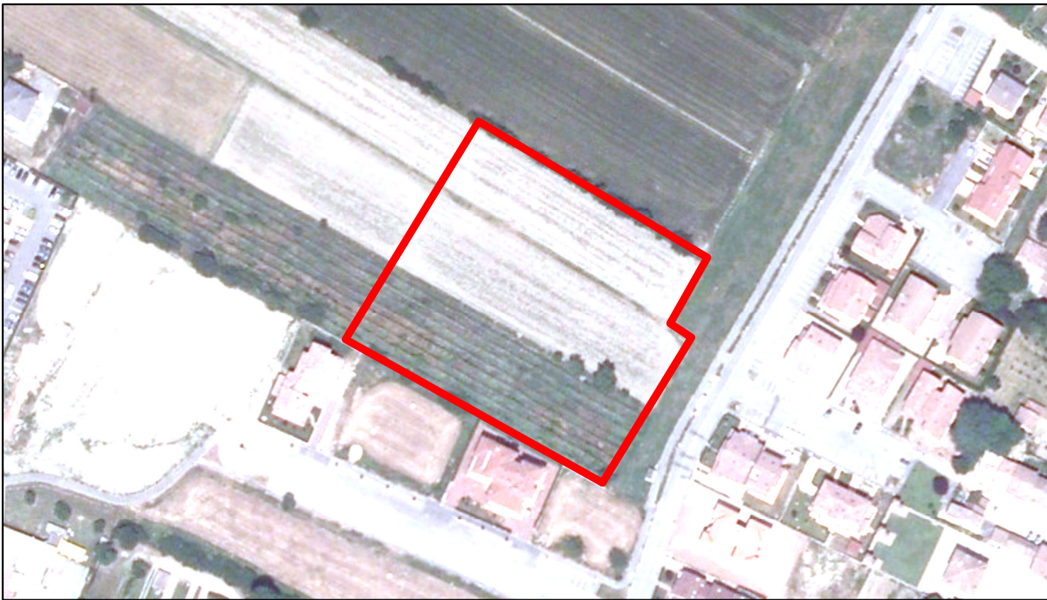
estratto ortofoto - Agea 2011 sc. 1:2000