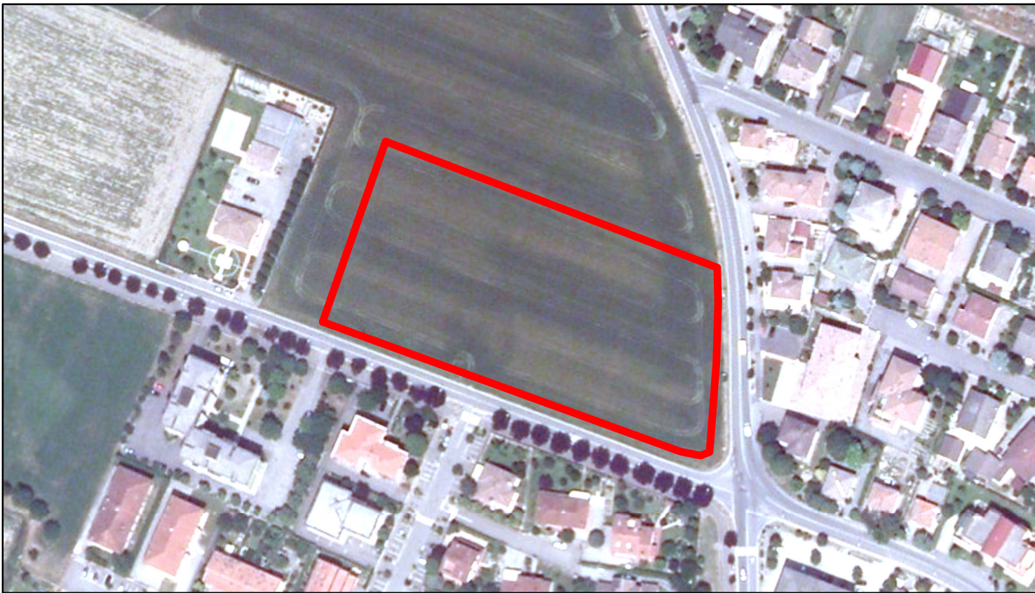
estratto ortofoto - Agea 2011 sc. 1:2000