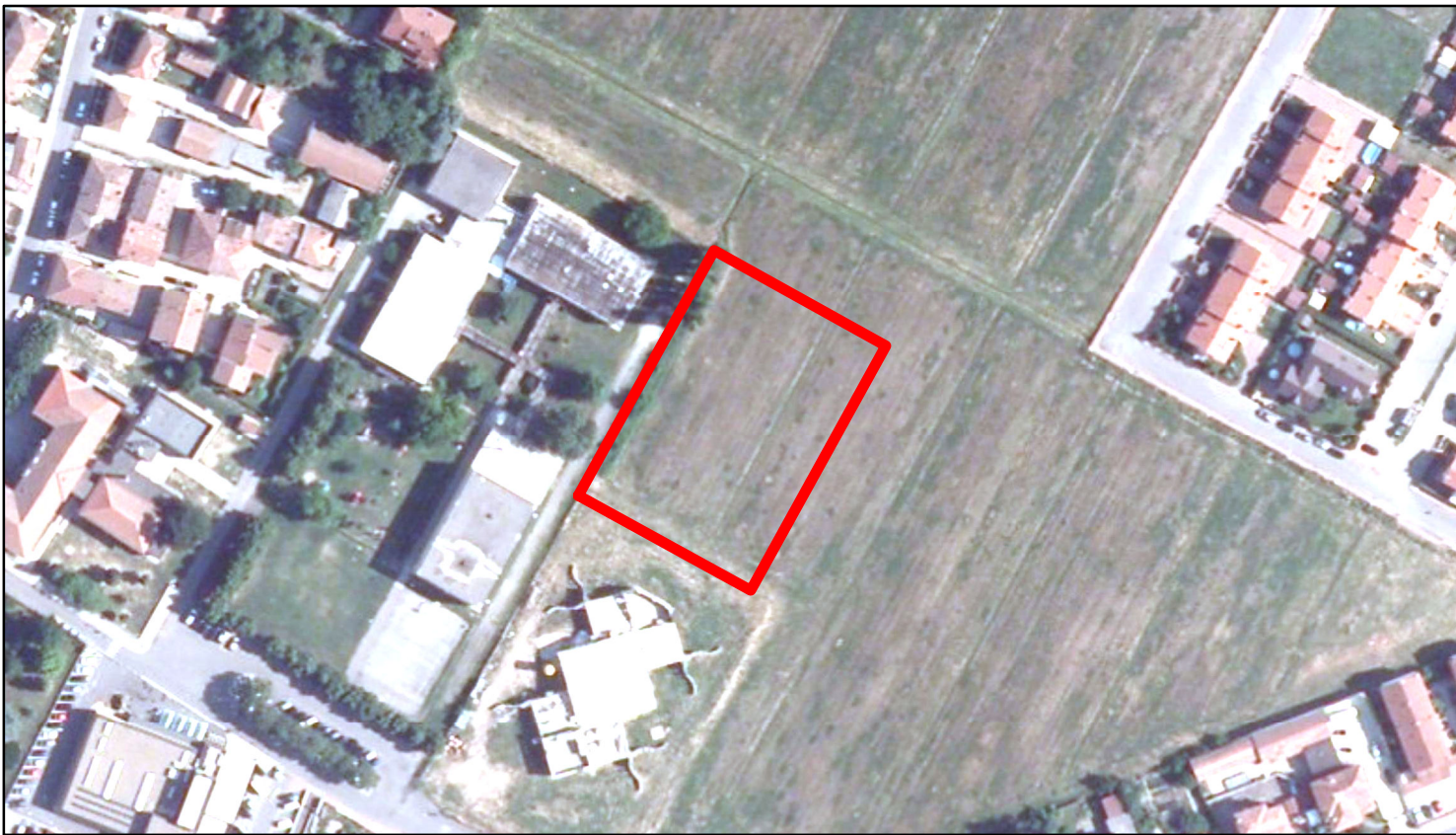
estratto ortofoto - Agea 2011 sc. 1:2000