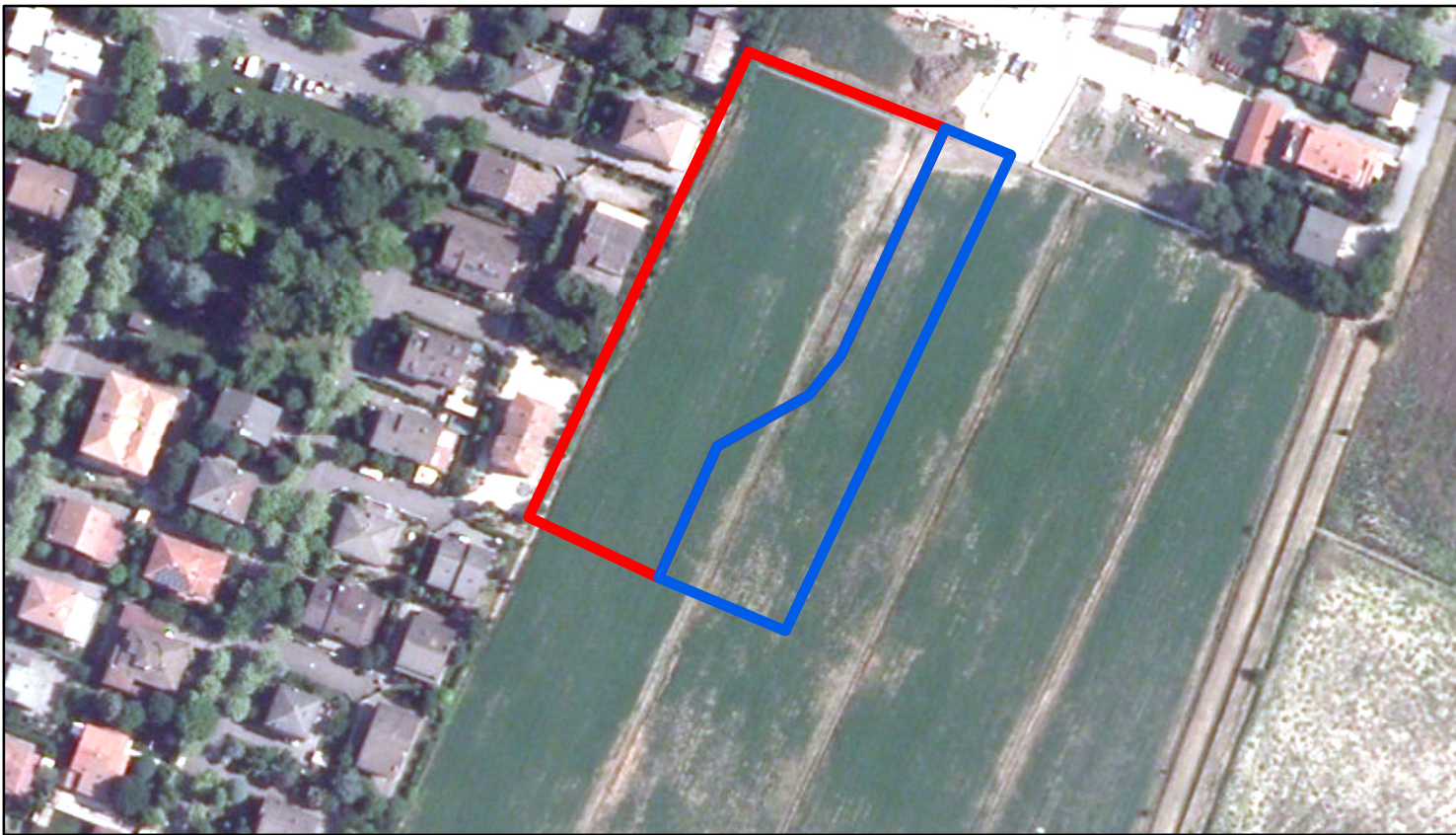
estratto ortofoto - Aga 2011 sc. 1:2000