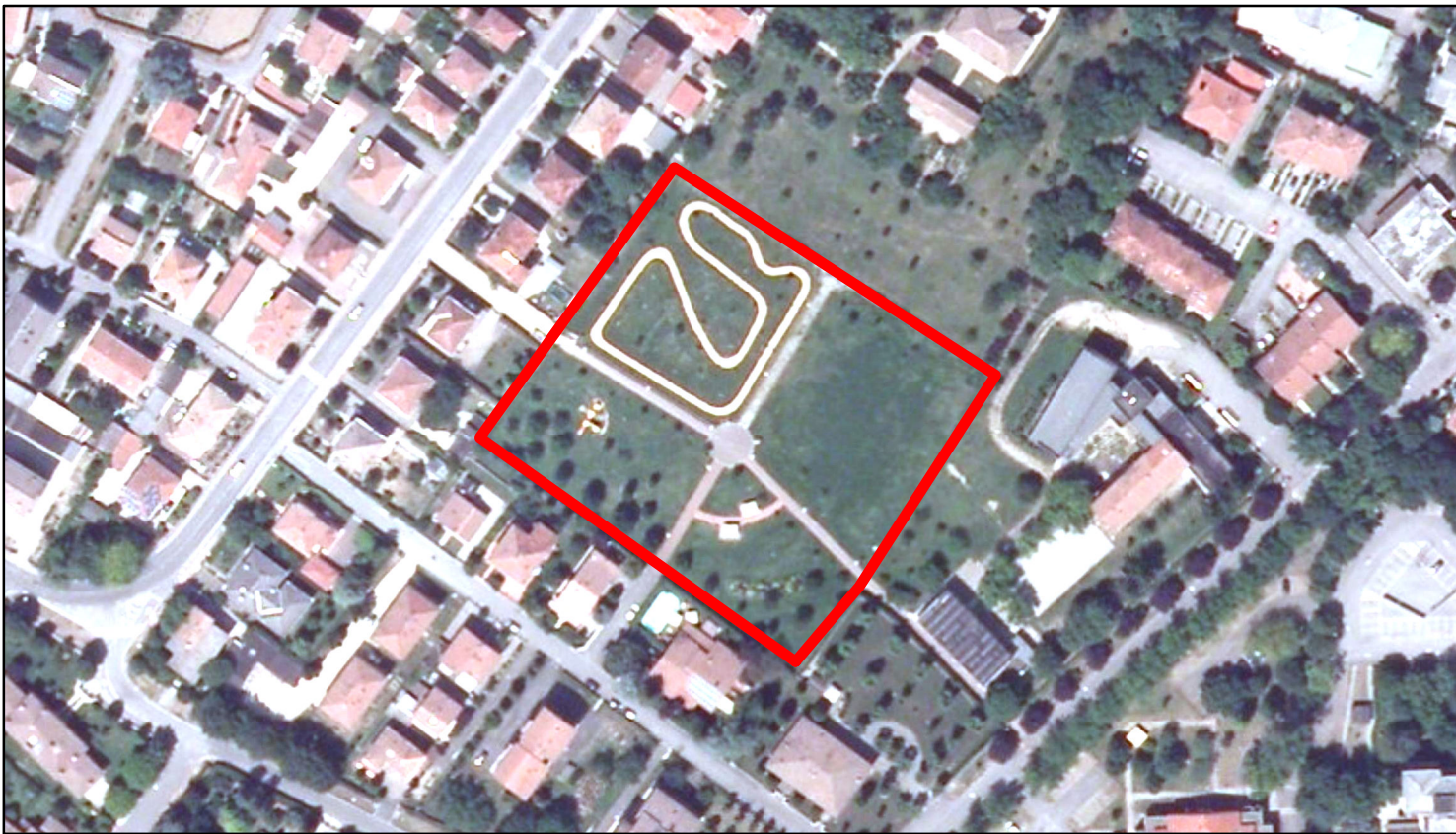
estratto ortofoto - Aga 2011 sc. 1:2000