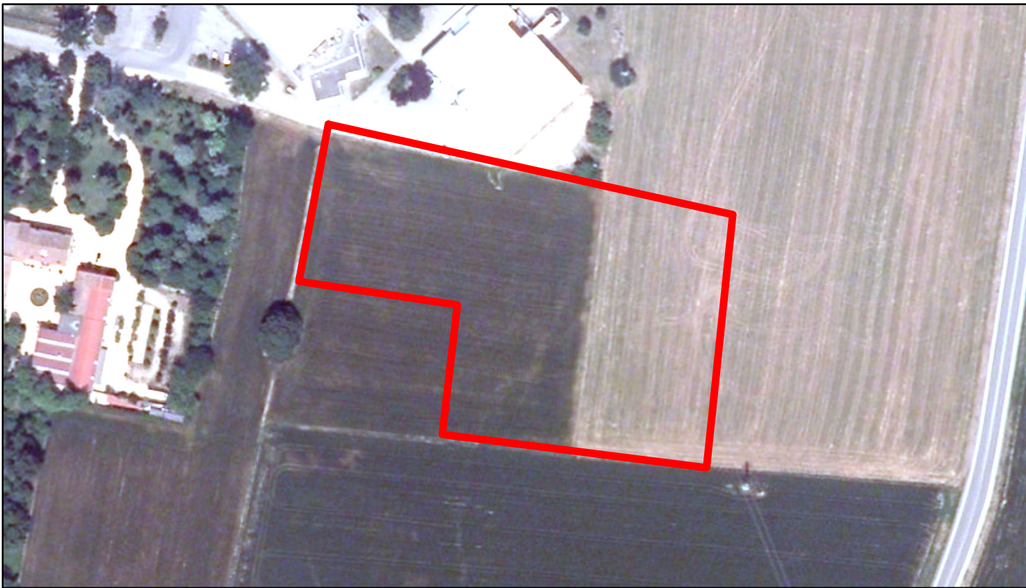
estratto ortofoto - Agea 2011 sc. 1:2000