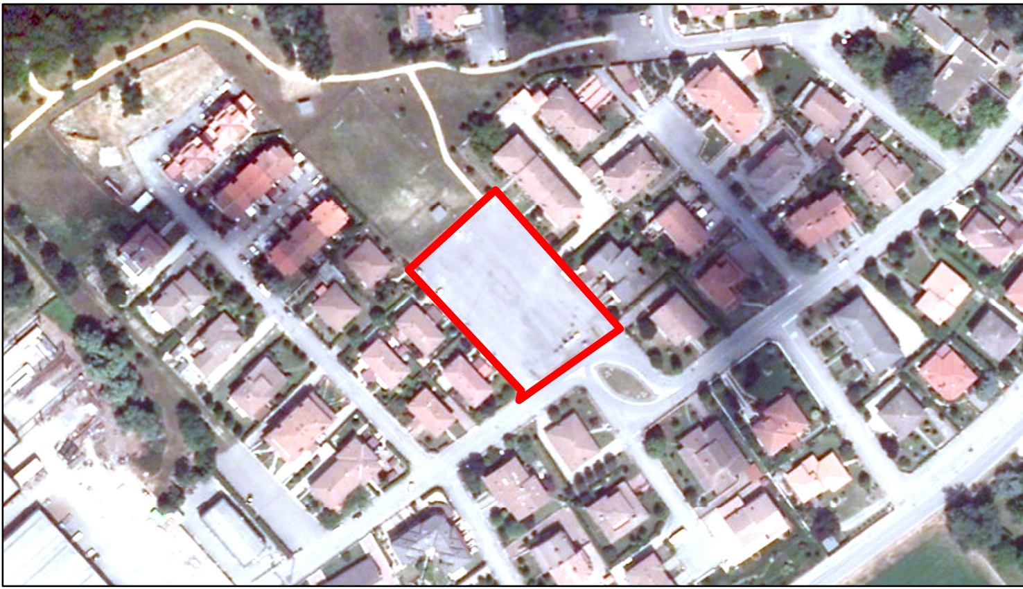
estratto ortofoto - Agea 2011 sc. 1:2000