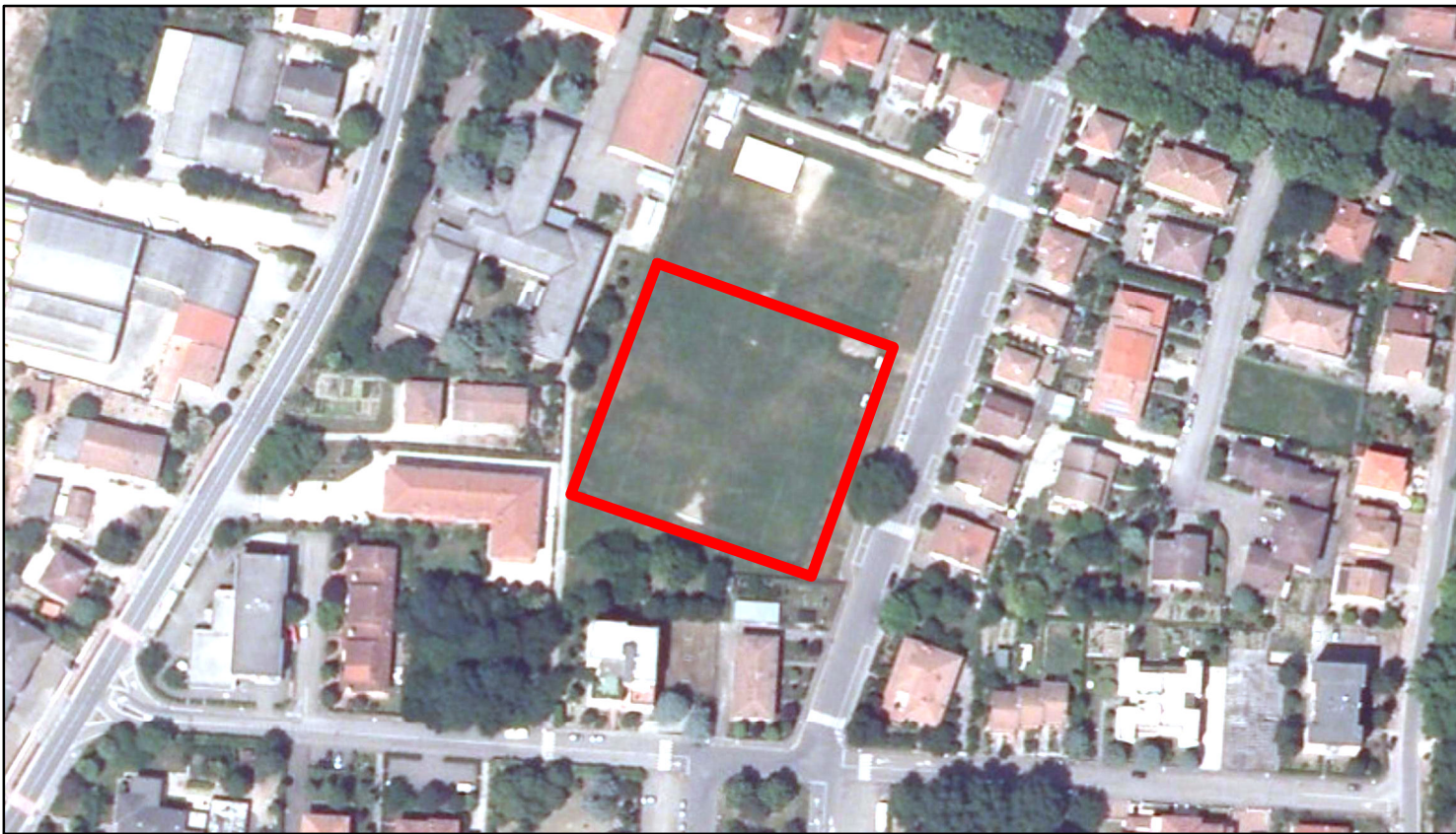
estratto ortofoto - Agea 2011 sc. 1:2000