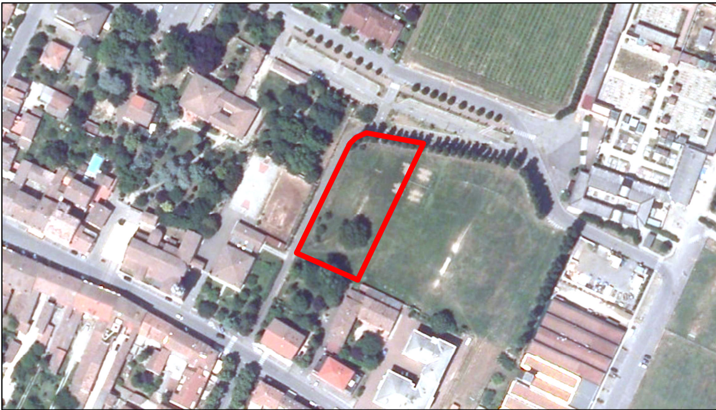
estratto ortofoto - Agea 2011 sc. 1:2000