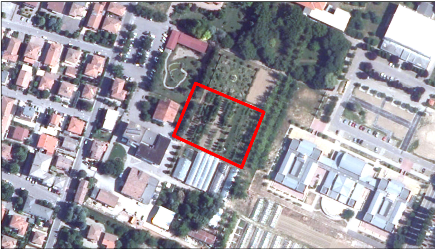
estratto ortofoto - Aga 2011 sc. 1:2000