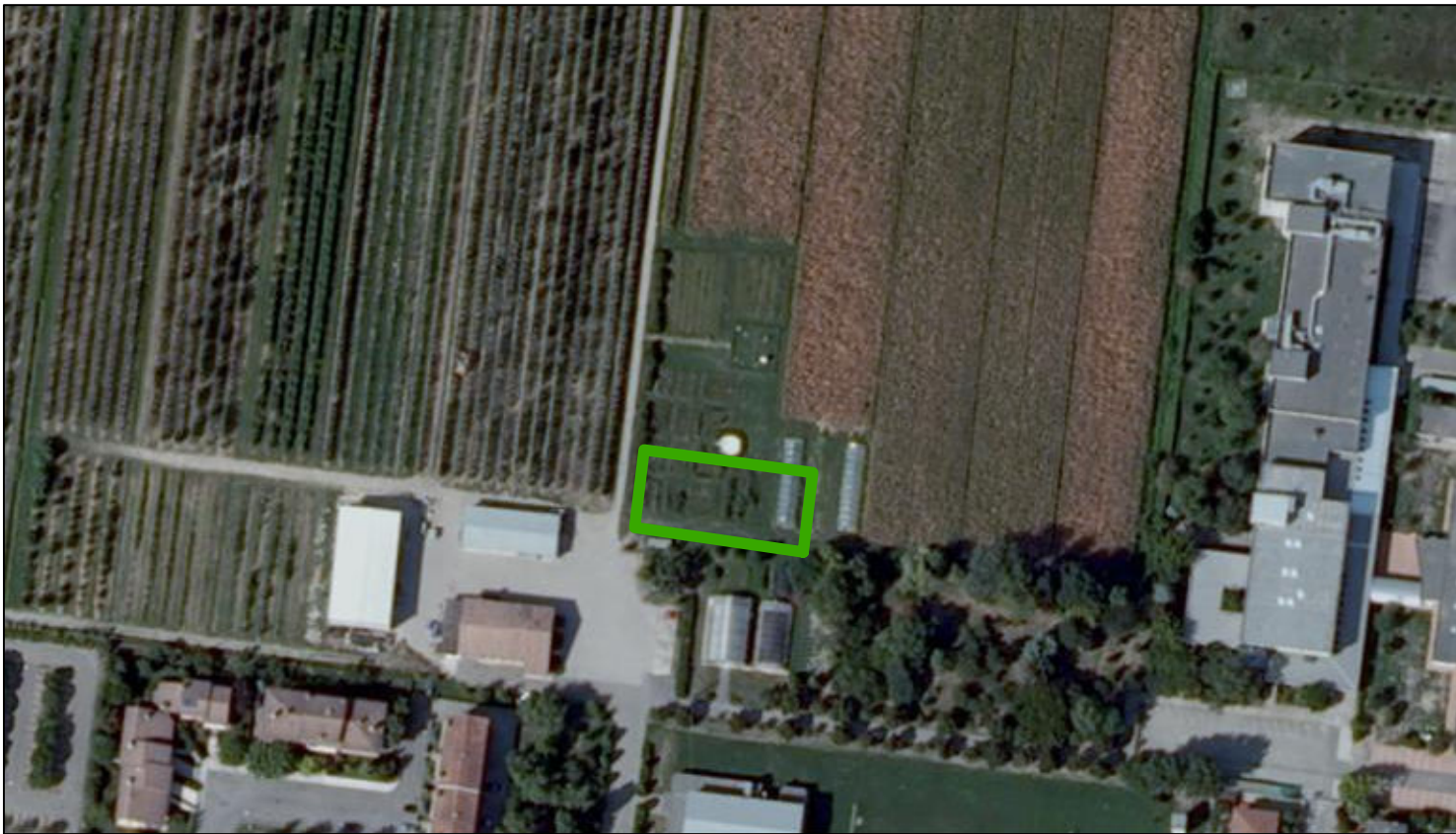
estratto ortofoto 0 25 50 100 150 200 Meters