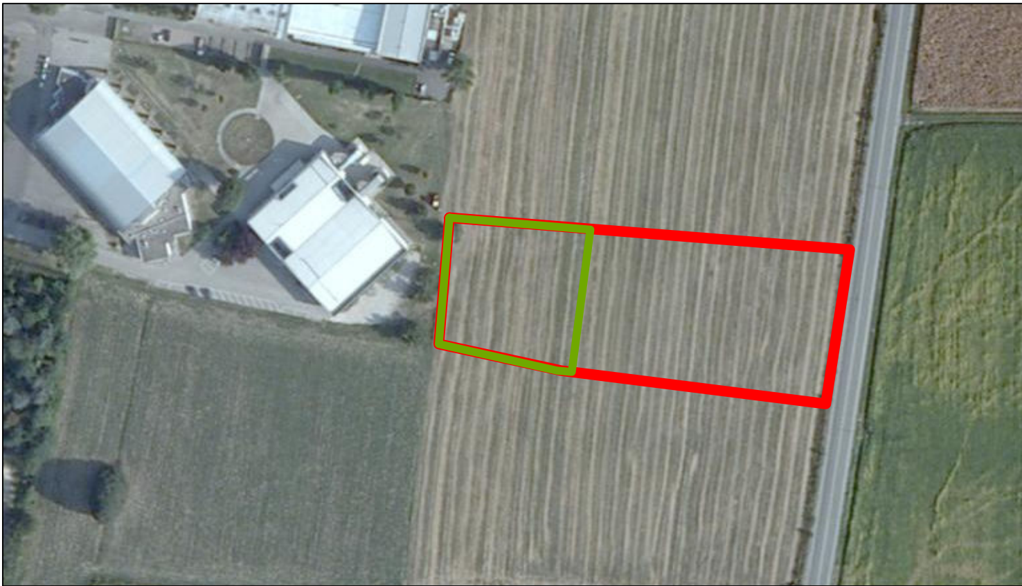
estratto ortofoto 0 25 50 100 150 200 Meters