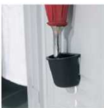
VASCHETTA RACCOGLI GOCCE