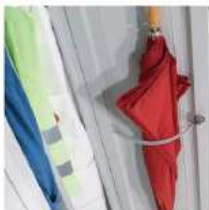
ANELLO PORTA OMBRELLI