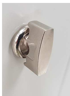
MANIGLIA IN METALLO LUCCHETTABILE CON FRIZIONE ANTISCASSO