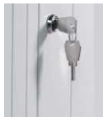
SERRATURA A CILINDRO