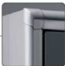
BORDO PERIMETRALE FRONTALE ARROTONDATO ANTI URTO