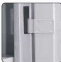
CERNIERE INTERNE SPECIALI ANTI SCASSO