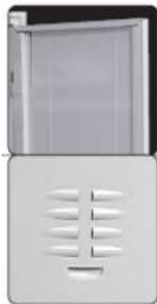
ANTE RINFORZATE E DOTATE DI FERITOIE DI AERAZIONE