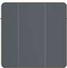
NERVATURE LONGITUDINALI SU FIANCHI E PORTE